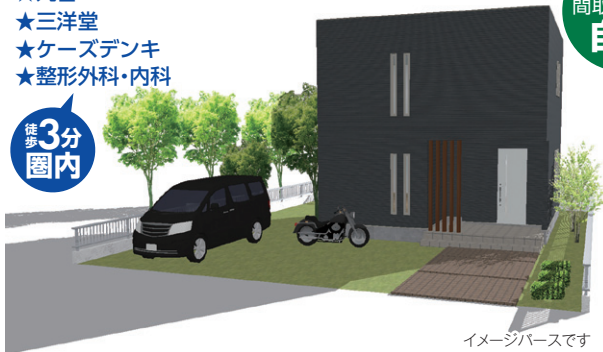
イメージバースです

■犬上郡豊郷町沢 ■近江鉄道豊郷駅徒歩10分 ■木造2階建 ■完成予定/平成27年10月(建築確認262号) ■土地206.35㎡ ■建延109.09㎡ ■日栄小学校徒歩約10分 ■売主