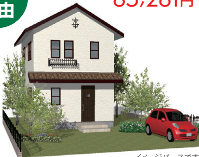
イメージバースです

■愛知郡愛荘町豊満 ■近江鉄道愛知川駅徒歩20分 ■木造2階建 ■完成予定/平成27年10月(建築確認262号) ■土地175.22㎡ ■建延105.79㎡ ■愛知川東小学校徒歩約5分 ■仲介