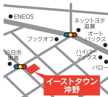
ナビ/東近江市東沖野2丁目1-26